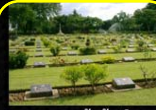
สุสานทหารสัมพันธมิตร