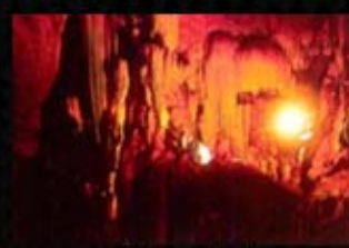
ถ้ำดาวดิงส์