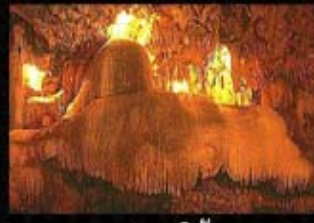
อุทยานแห่งชาติถ้ำธารลอด