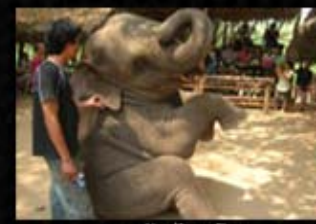
ปางช้างไทรโยค