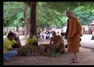
วัดป่าหลวงตาบัว