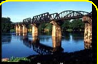
สะพานข้ามแม่น้ำแคว