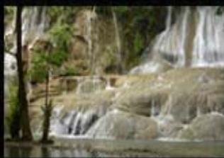
น้ำตกไทรโยคใหญ่