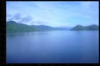
เขื่อนศรีนครินทร์