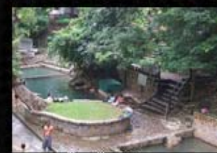
น้ำพุร้อนหินดาด