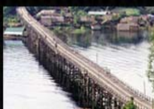
สะพานมอญ