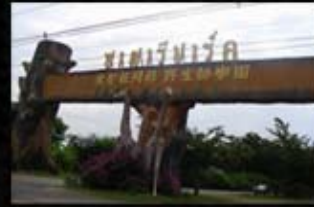
ซาฟารีปาร์ค