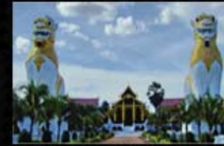
โรงถ่ายภาพยนตร์(พระนเรศวร)