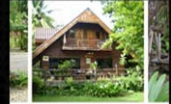
ไร่คุณมน