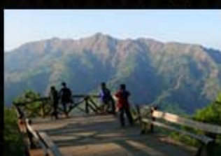
อุทยานแห่งชาติทองผาภูมิ