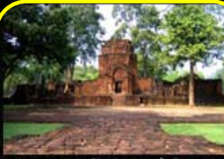
อุทยานประวัติศาสตร์เมืองสิงห์