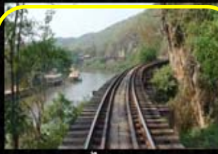
ทางรถไฟสายมรณะ