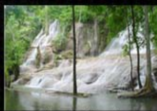
น้ำตกไทรโยคน้อย