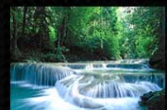
น้ำตกเอราวัณ