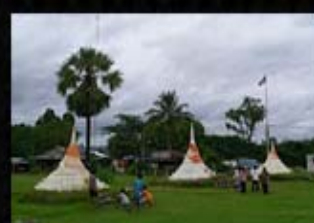
ด่านเจดีย์สามองค์