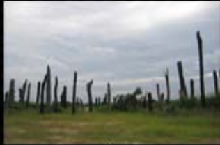
อุทยาน ต้นตะเคียน