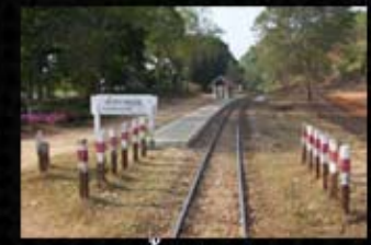
ถ้ำกระแซ