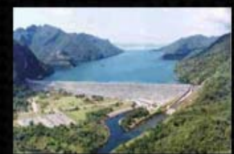
เขื่อนวชิราลงกรณ