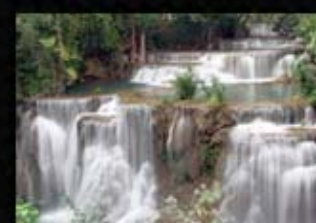
น้ำตกห้วยแม่ขมิ้น