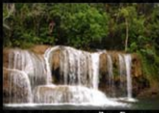
อุทยานแห่งชาติไทรโยค