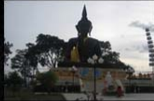
วัดพระนิล (วัดเขาจินดาราม )